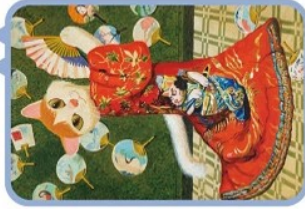
《穿和服的卡貓兒》陳內